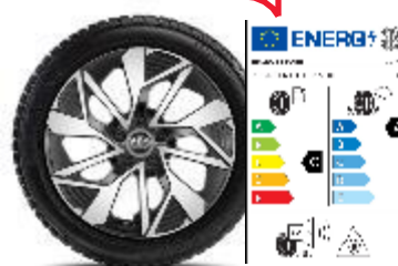
Комплект зимни гуми BRIDGESTONE с алуминиеви джанти 18" TMEWA42065DY