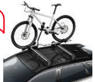
Държач за велосипед PW30800007