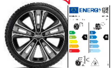
Комплект зимни гуми BRIDGESTONE с алуминиеви джанти 18" TMEWA42056DY